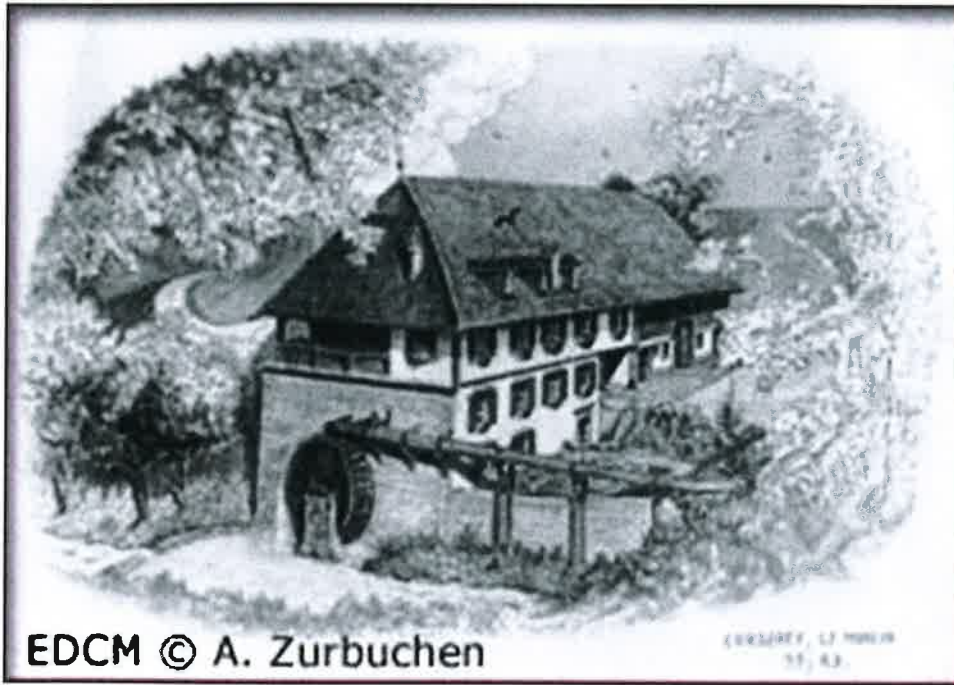
Le moulin de Corserey à l'époque